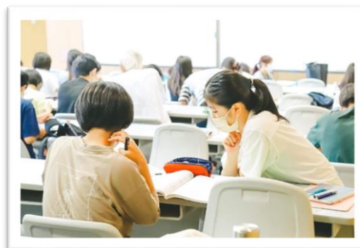
（学園都市校の学習室の風景（UNITY セミナー4室））