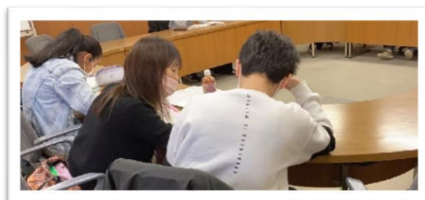
（住吉校の学習室の風景（東灘区文化センター））