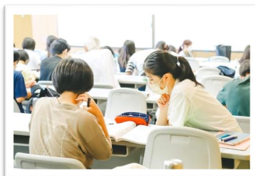
（学園都市校の学習室の風景（UNITY セミナー4室））